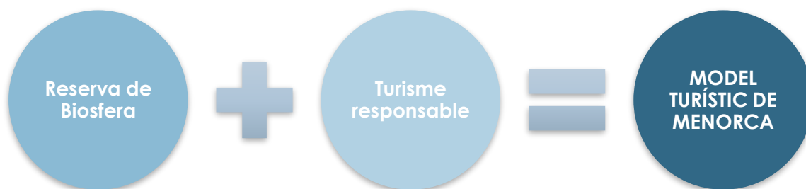
Figura 1. Principis del model turístic de Menorca

El Pla de desenvolupament turístic de Menorca 2018-2025, defineix el model turística per l'illa com aquell que es basa en un desenvolupament turístic que vetlla per la conservació del patrimoni natural i cultural i contribueix a satisfer les necessitats socials, culturals i econòmiques dels ciutadans, promovent la investigació i la participació social (fig. 1).